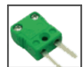
MM Conector MINI Macho