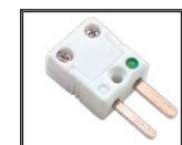
MM Conector MINI Macho cerámico