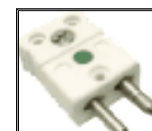
SM Conector STD Macho cerámico