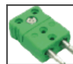
SM Conector STD Macho